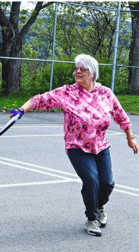
Saint-Mathieu-de-Rieux, Bas-Saint-Laurent 2023